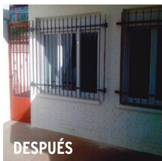
Cerrajería exterior y acondicionamiento de la casa del conserje del CEIP Juan Zaragüeta. JUNTA MUNICIPAL DE HORTALEZA

cambiado todos los fluorescentes del colegio y se han remodelado los baños de varias estancias. Integrantes del AMPA del CEIP Juan Zaragüeta nos hacían llegar estas palabras: “La rehabilitación de la casa del conserje ha quedado estupenda y el resultado de los cerramientos también es magnífico, pues las ventanas y persianas nuevas mejoran el aislamiento de ruido y temperatura, aunque es cierto que ha quedado alguna sin la reja que tenía y no nos han comentado que vayan a ponerlas. En cuanto al patio, iban a terminar la mitad del suelo que falta por renovar, pero, a finales de septiembre, no habían empezado y la mayoría de las canastas siguen sin aros o tableros. Según comentan los vecinos y alumnos, las obras de la casa del conserje tomaron un ritmo muy fuerte al terminar el curso, pero pararon en agosto hasta su remate en septiembre”.