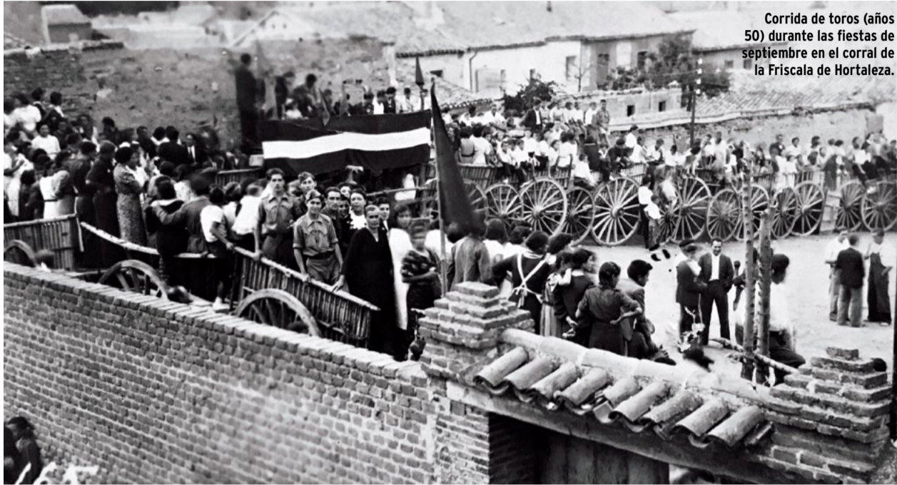
Corrida de toros (años 50) durante las fiestas de septiembre en el corral de la Friscale de Hortaleza.

Del 22 de octubre al 25 de noviembre, la biblioteca Huerta de la Salud presenta las Jornadas sobre Historia de Hortaleza, con debates, conferencias, visitas guiadas y la puesta en marcha del plan "Memoria de los Barrios. Hortaleza" del Ayuntamiento