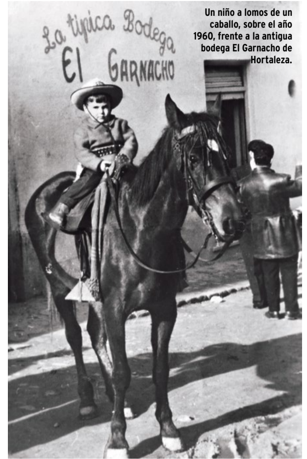
Un niño a lomos de un caballo, sobre el año 1960, frente a la antigua bodega El Garnacho de Hortaleza.